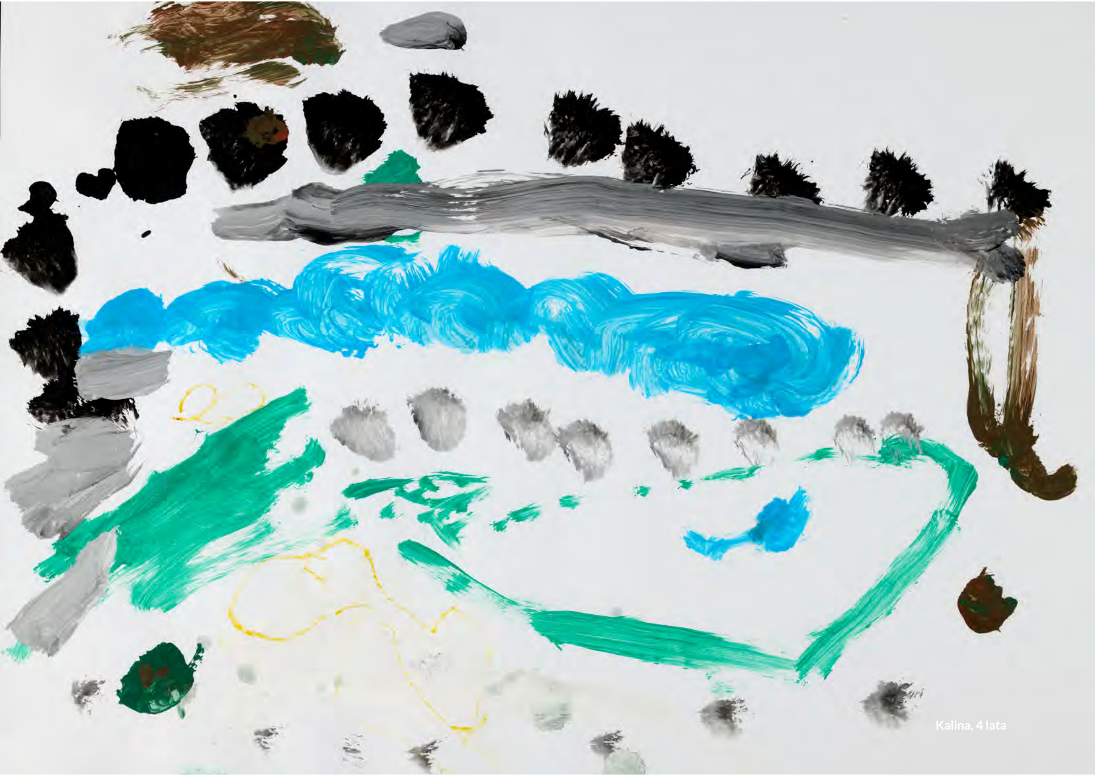
Kalina, 4 lata