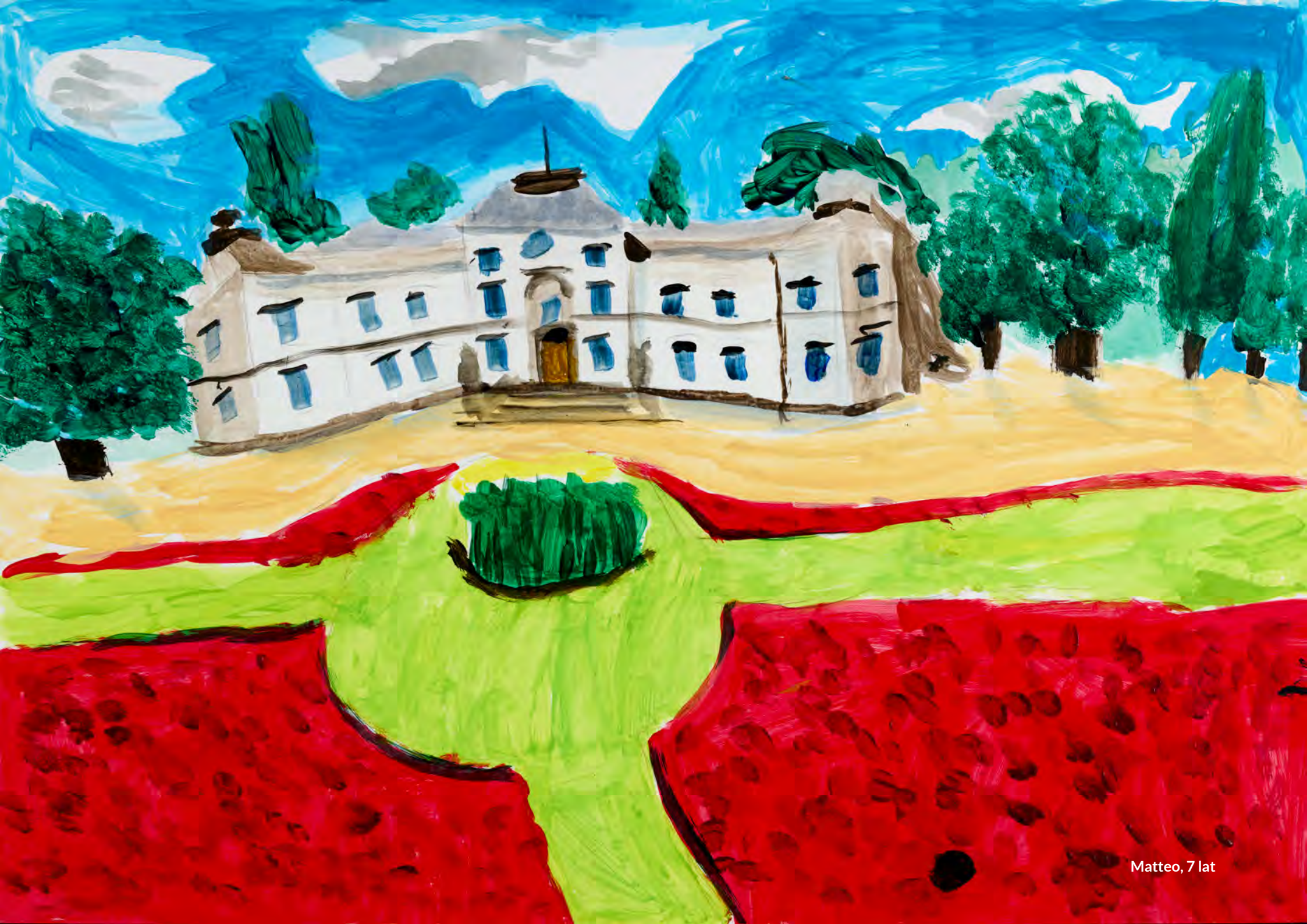
Matteo, 7 lat