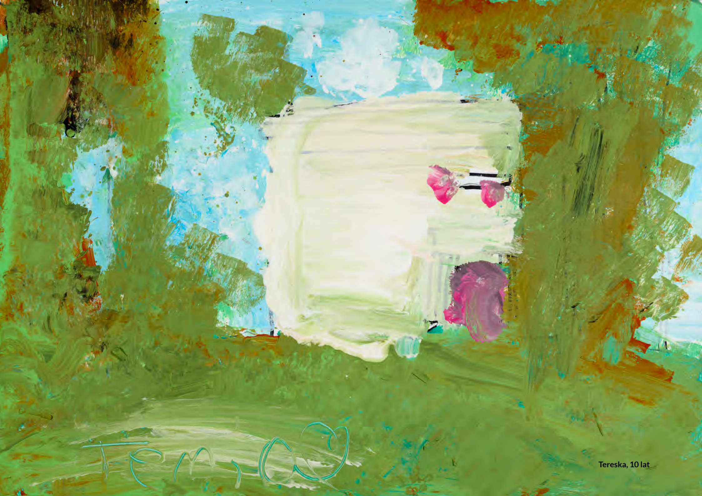
Tereska, 10 lat