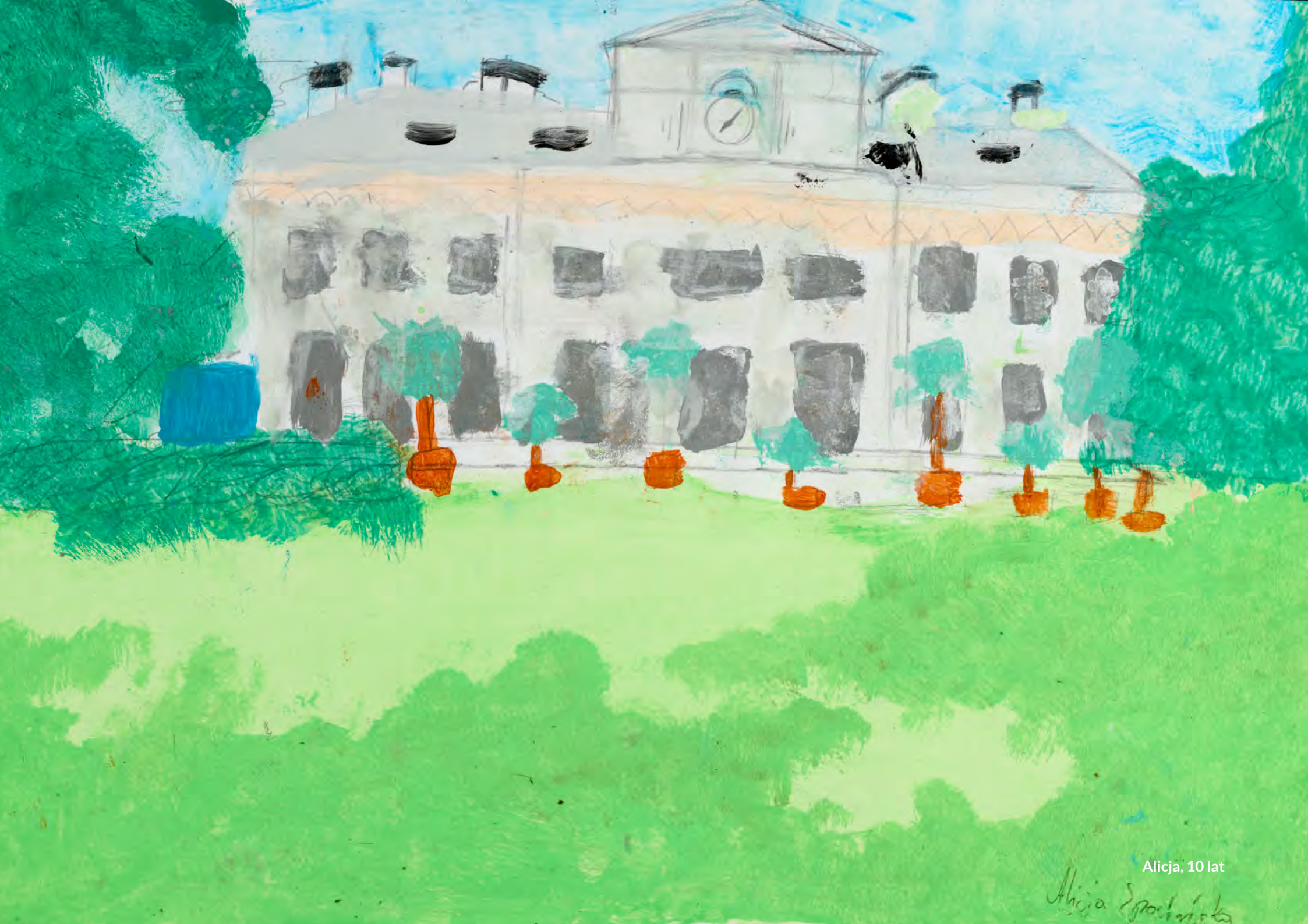
Alicja, 10 lat