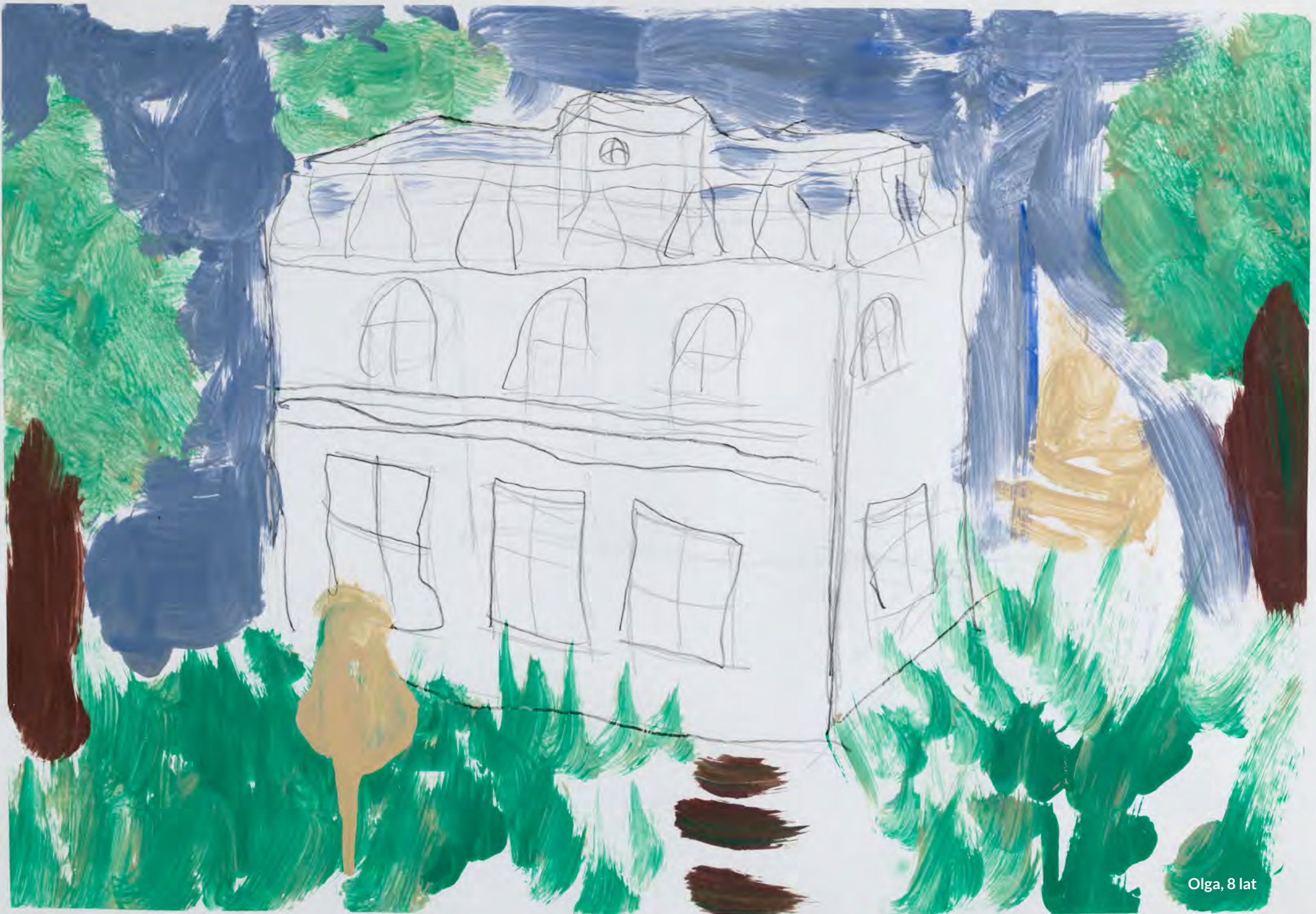
Olga, 8 lat