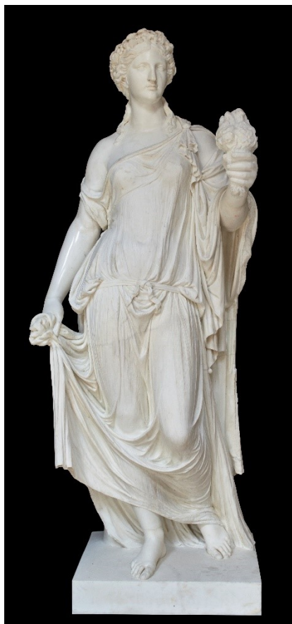
Rzeźba w Starej Oranżerii