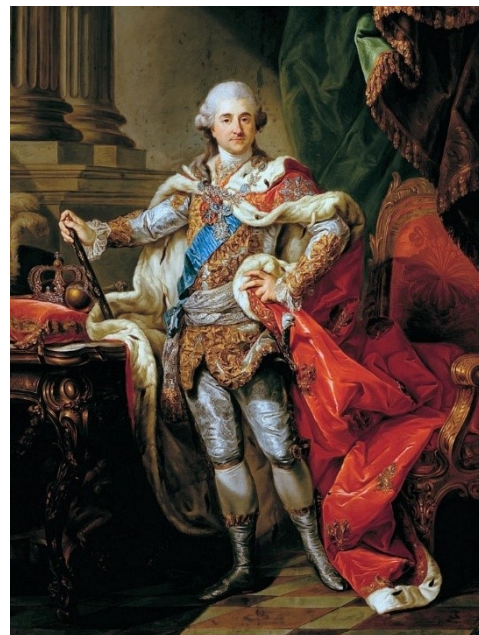
Król Stanisław August

Rzeźby przedstawiały postacie z historii i mitologii.