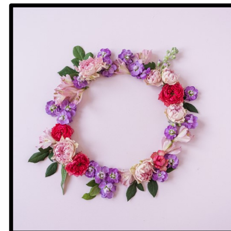
wianek z kwiatów