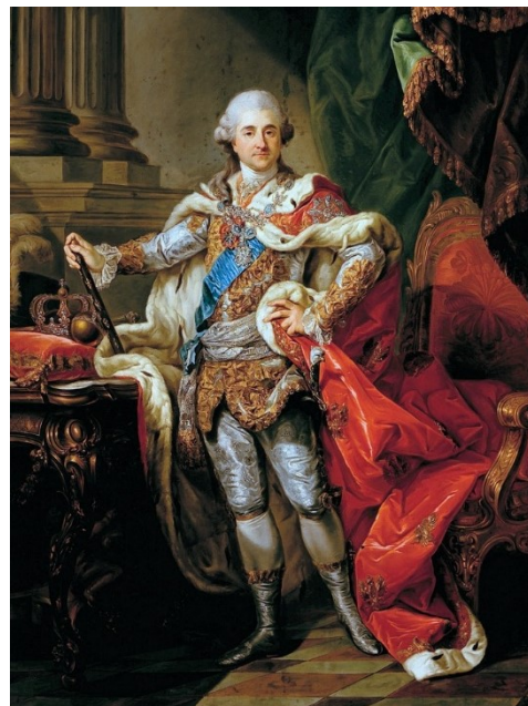
Król Stanisław August