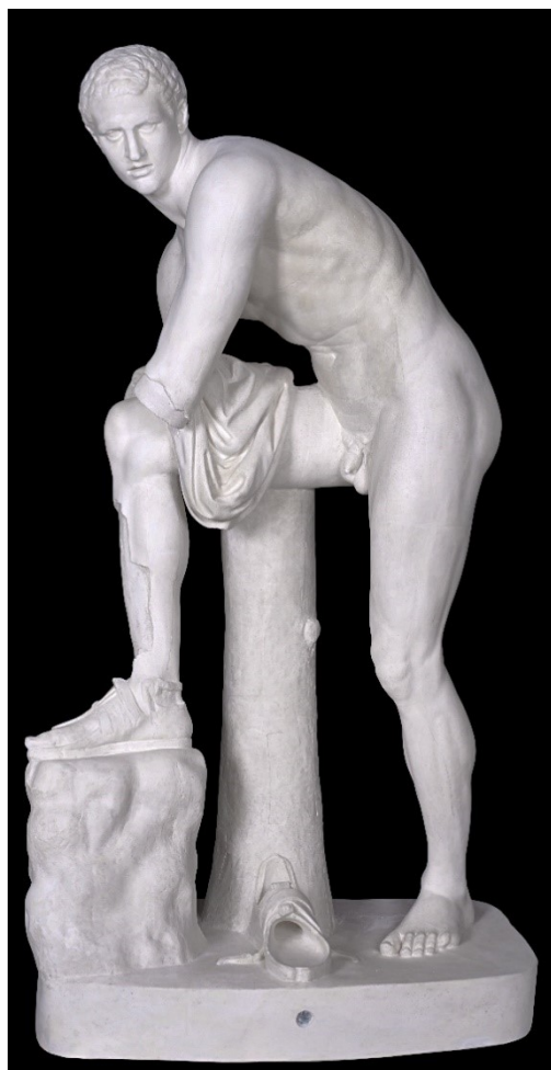
Rzeźba w Starej Oranżerii

Kopię rzeźby Hermesa w Starej Oranżerii zrobiono na wzór rzeźby z Muzeum Luwru w Paryżu.