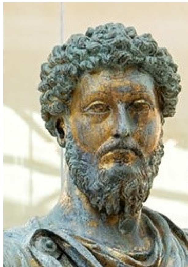
Pomnik Marka Aureliusza w Rzymie