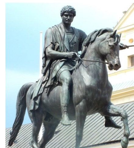
Pomnik Józefa Poniatowskiego w Warszawie

Pomnik stoi przed Pałacem Prezydenckim w Warszawie.