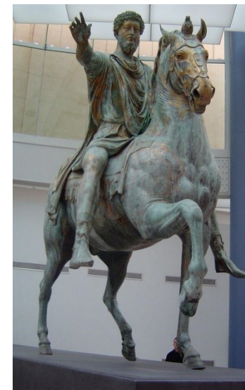
Pomnik Marka Aureliusza w Rzymie

Na przykład cesarzom, królom i dowódcom wojsk.