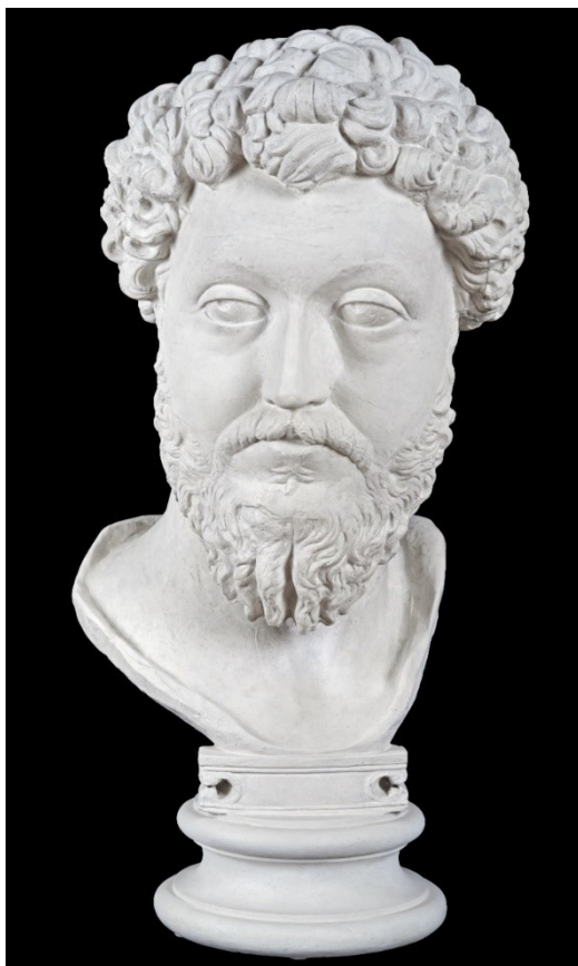
Rzeźba w Starej Oranżerii

Kopię rzeźby Marka Aureliusza ze Starej Oranżerii zrobiono na wzór rzeźby z Muzeów Kapitołińskich w Rzymie.