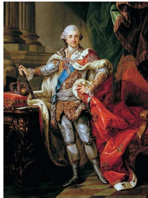
Król Stanisław August

Rzeźby przedstawiały postacie z historii i mitologii.