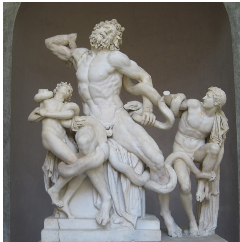
Rzeźba w Muzeach Watykańskich