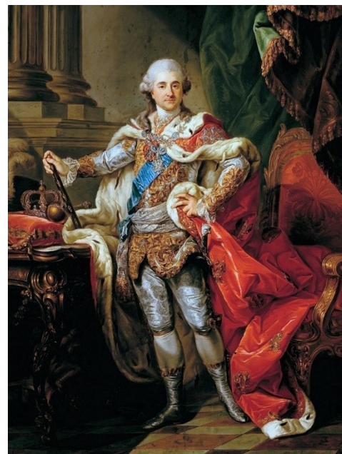
Król Stanisław August

Rzeźby przedstawiały postacie z historii i mitologii.