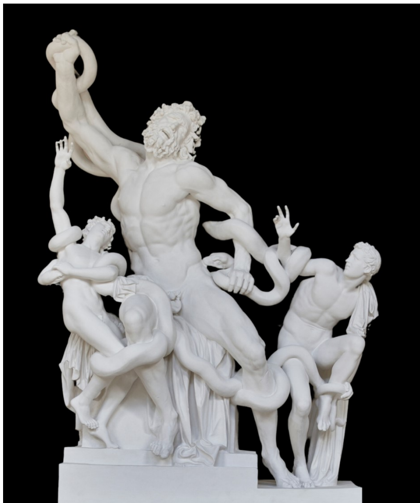
Rzeźba w Starej Oranżerii