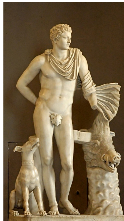
Rzeźba w Muzeach Watykańskich