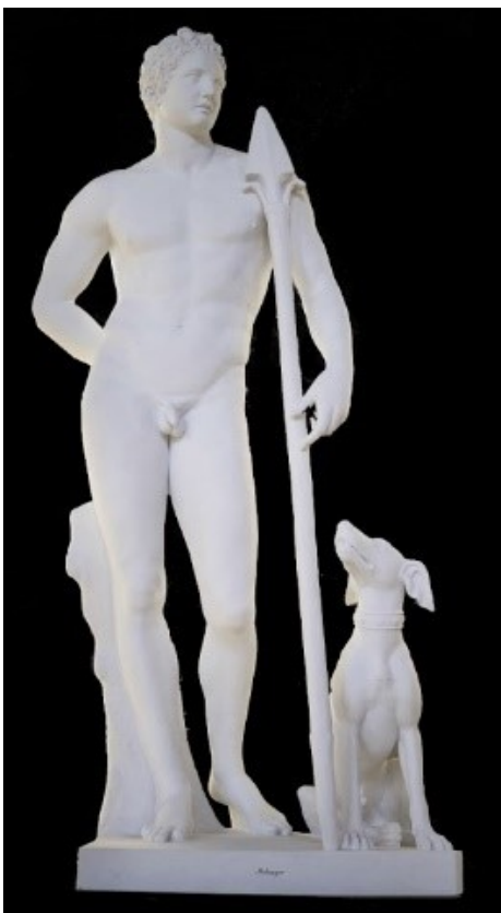
Rzeźba w Starej Oranżerii