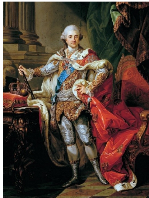
Król Stanisław August

Rzeźby przedstawiały postacie z historii i mitologii.