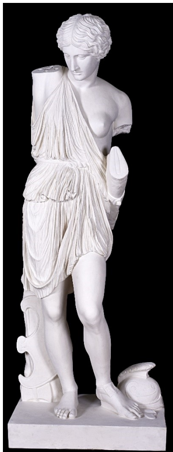
Rzeźba w Starej Oranżerii