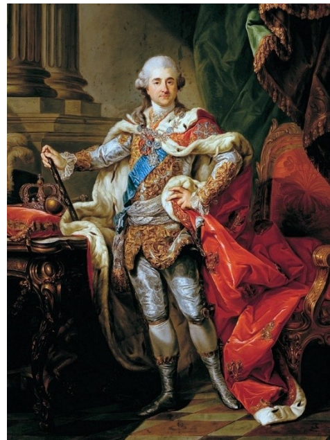
Król Stanisław August

Rzeźby przedstawiały postacie z historii i mitologii.