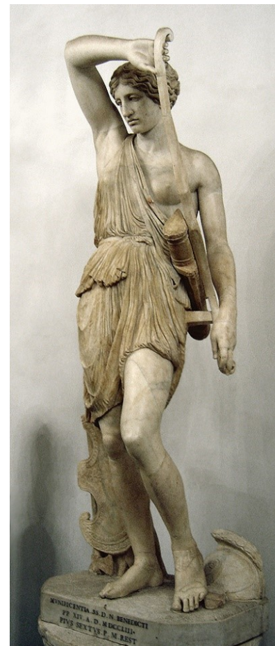
Rzeźba w Muzeach Watykańskich