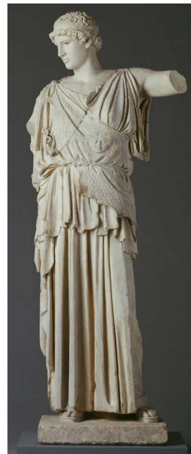
Rzeźba w Państwowych Zbiorach Sztuki