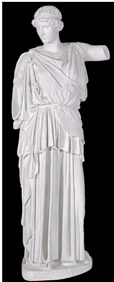
Rzeźba w Starej Oranżerii