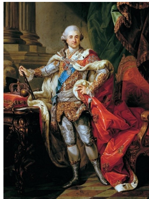
Król Stanisław August

Rzeźby przedstawiały postacie z historii i mitologii.