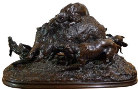
Polowanie na dzika, Pierre Jules Mène