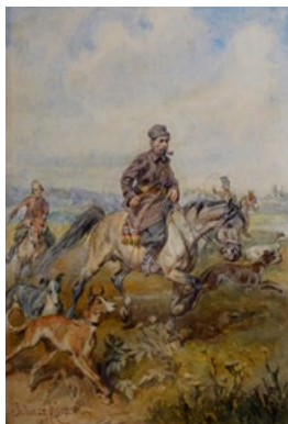
Wyjazd na polowanie