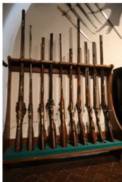
Kolekcja strzelb myśliwskich

Pomiędzy karabinami znajduje się arkebuz z weellockiem z połowy XVIII w. Broń ta jest inkrustowana kością słoniową. Dekoracja przedstawia biegnącego łosia.