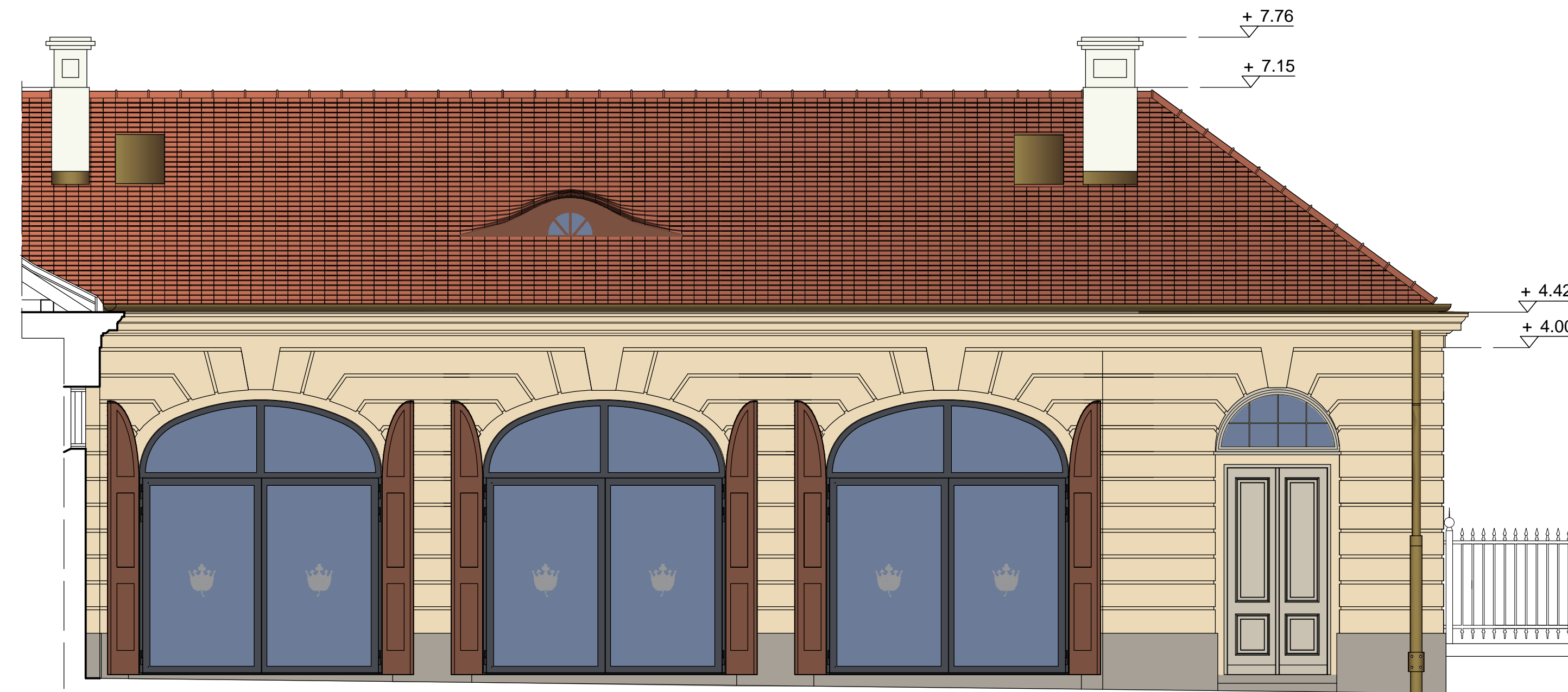
ELEWACJA WOZOWNI ZACHODNIEJ OD STRONY DZIEDZIŃCA Z OTWARTYMI WROTAMI DREWNIANYMI