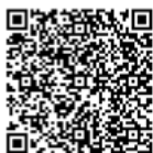
Lekcje muzealne Muzeum Łowiectwa i Jeździectwa