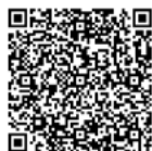
Lekcje muzealne Muzeum Łazienki Królewskie

Zapraszamy do skorzystania z oferty stacjonarnych lekcji muzealnych, odbywających się w zabytkowych obiektach i historycznych ogrodach. Polecamy również lekcje muzealne w Muzeum Łowiectwa i Jeździectwa.